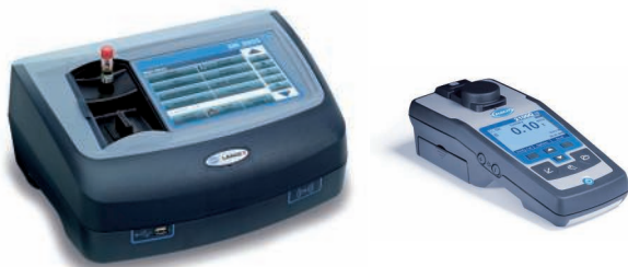
Instruments de paillasse et portables pour l'analyse en laboratoire ; services d'inspection, de maintenance et de qualification disponibles

* Pour une obtenir la liste de paramètres et solutions supplémentaires, veuillez contacter votre représentant HACH LANGE ou visiter notre site.