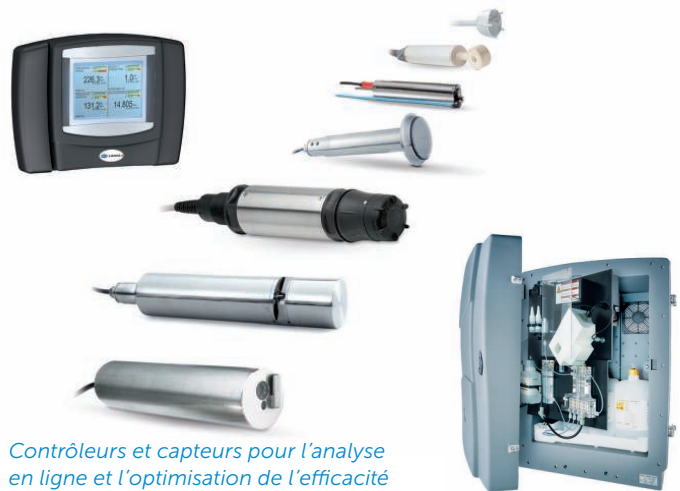
Contrôleurs et capteurs pour l'analyse en ligne et l'optimisation de l'efficacité des procédés