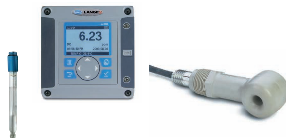
Contrôleurs et capteurs pour l'analyse en ligne