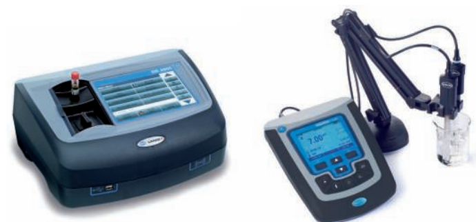
Instruments de paillasse et portables pour l'analyse en laboratoire, comprenant des tests spéciaux pour les bains de plaquage Services d'inspection, de maintenance et de qualification disponibles

* Pour une obtenir une liste de paramètres et solutions supplémentaires, veuillez contacter votre représentant HACH LANGE local ou visiter notre site Web.